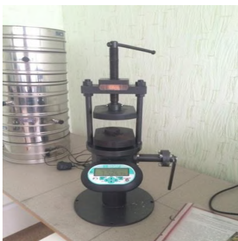
Рис. 3. Прессовальный аппарат для проверки брикетов на сжатие (максимальная нагрузка 7тонн)

После вылеживания брикеты подвергались прочностным испытаниям. Были определены максимальная сила сжатия с помощью гидропресса ПРГ-1 (рис. 3) и количество сбрасываний с двухметровой высоты, которое выдержит брикет до появления первых трещин.