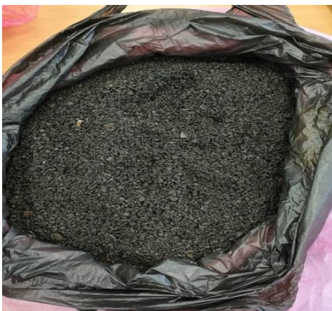
Рис. 1. Металлизованная мелочь ЦГБЖ-2 АО «ЛГОК»

В данном эксперименте определялось, какое выбрать время действия давления, чтобы брикет был прочным.