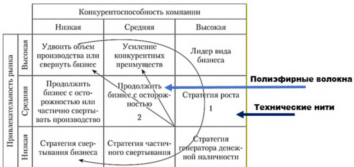
Рис. 1. Матрица Shell/DPM

Модель DPM представляет двумерную таблицу, где оси X и Y отражают соответственно сильные стороны организации и отраслевую привлекательность. На рисунок 1 были нанесены следующие виды продукции, учитывая суммарные баллы.