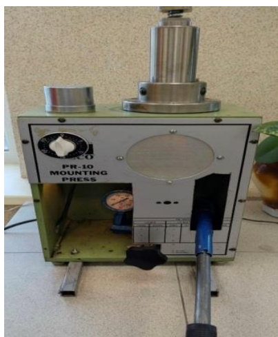
Рис. 2. Пресс для получения брикетов

Для изготовления брикетов был использован пресс LECO PR-10 MOUNTING (рис. 2).