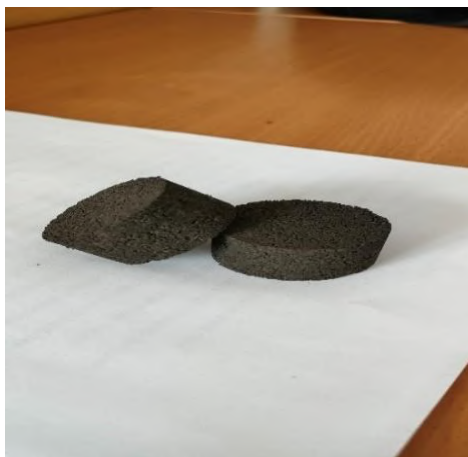
Рис. 4. Брикеты, полученные из мет. мелочи ЦГБЖ-2 АО «ЛГОК»

Затем заполняли форму подготовленной смесью по 70-75г и, под прессом, держали под давлением 400 бар брикеты в течение трех, пяти и восьми минут. По итогам эксперимента были получены брикеты цилиндрической формы (рис. 4), диаметр которых составил 4 см, а высота 2 см.