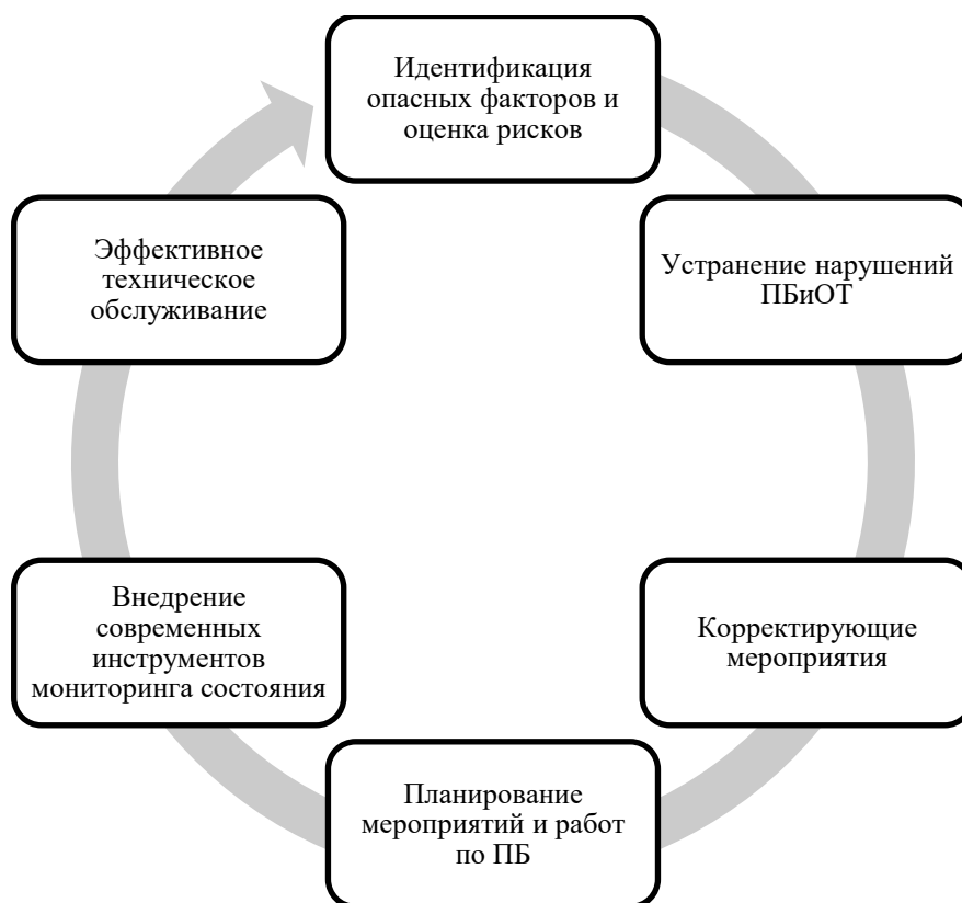
Рис. 1. Петля промышленной безопасности

Компании, эксплуатирующие опасные производственные объекты, внедряют общую систему управления ПБиОТ, которая предусматривает циклическую последовательность основных управленческих действий, направленных на поддержание и постоянное повышение уровня безопасности. Как показано на рисунке 1, такая последовательность может быть представлена в виде цикла промышленной безопасности и охраны труда.