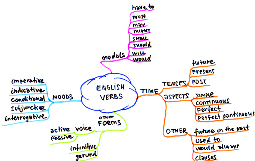
Рис. 1. Английские глаголы

Главной функцией Mind Map как в целом, так и на занятиях по английскому языку является организация и структурирование знаний: с помощью Mind Maps студенты могут систематизировать новую лексику (рис. 1), грамматические конструкции и темы, разделяя их на подгруппы и устанавливая логические связи между ними. [1] Это особенно полезно для визуализации сложных грамматических правил или схем времен.