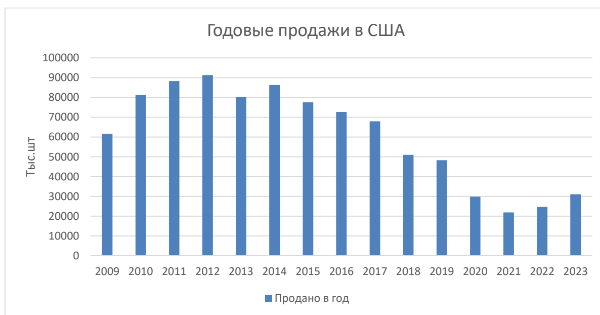
Рис. 1. Динамика продаж Chevrolet Camaro в США

В отличие от него, новая модель взлетела вверх по продажам, начав с 61 648 единиц уже в год своего появления. Продолжая рост, в 2010 году она достигла пика в 80 тысяч проданных экземпляров в США, и этот успех оставался неизменным в течение последующих пяти лет. Однако с 2015 по 2017 год, цифры немного снизились, достигнув отметки в 68 тысяч [3] (рис.1).