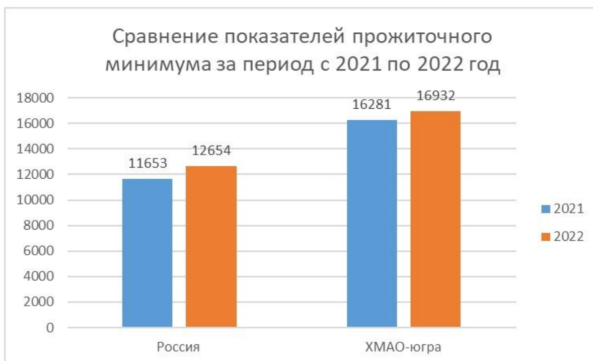
Рис. 1. Сравнение показателей прожиточного минимума за период с 2021 по 2022 год

Огромное влияние на уровень безработицы оказывает внешняя политическая ситуация в стране, также внутренние проблемы, связанные с экономикой.