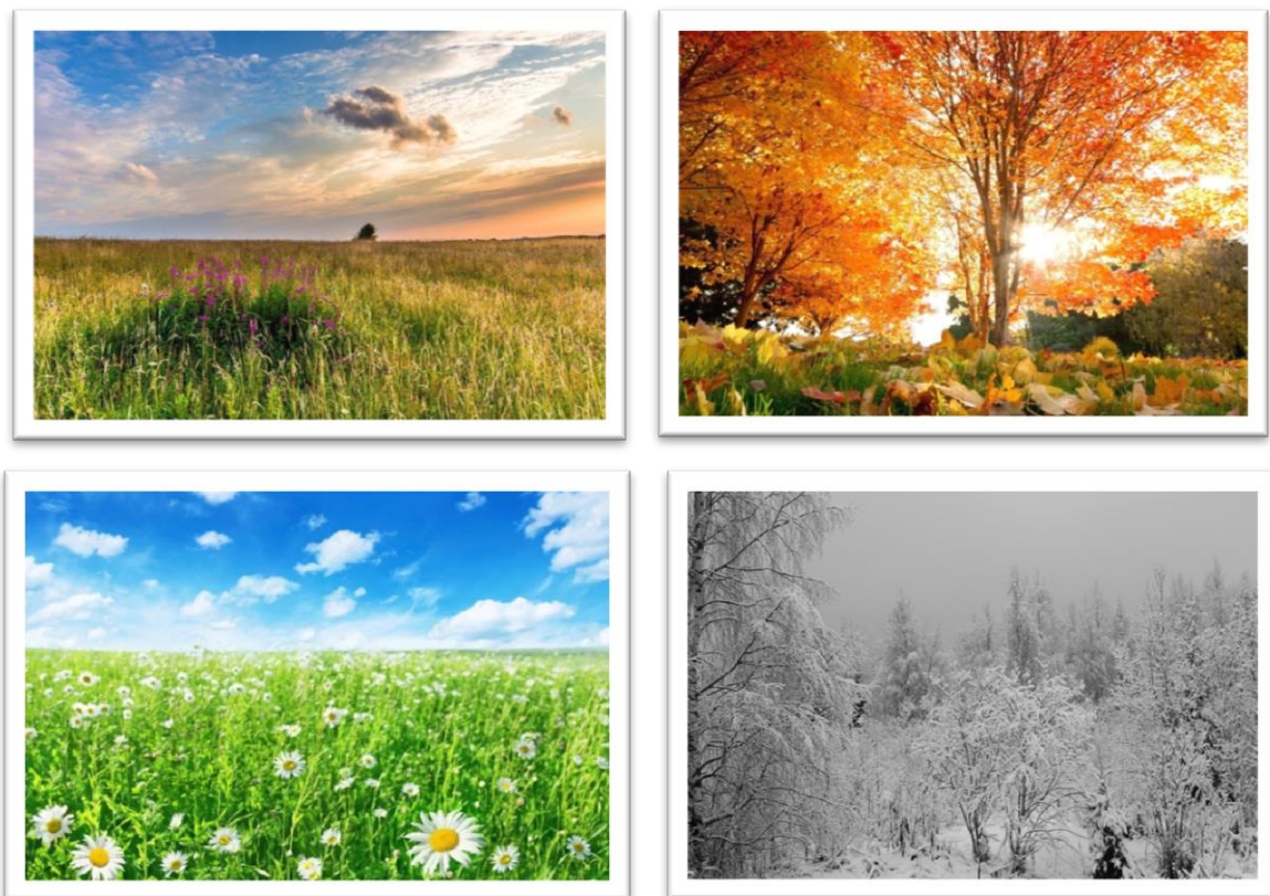
Рис. 2. Набор фоновых заставок