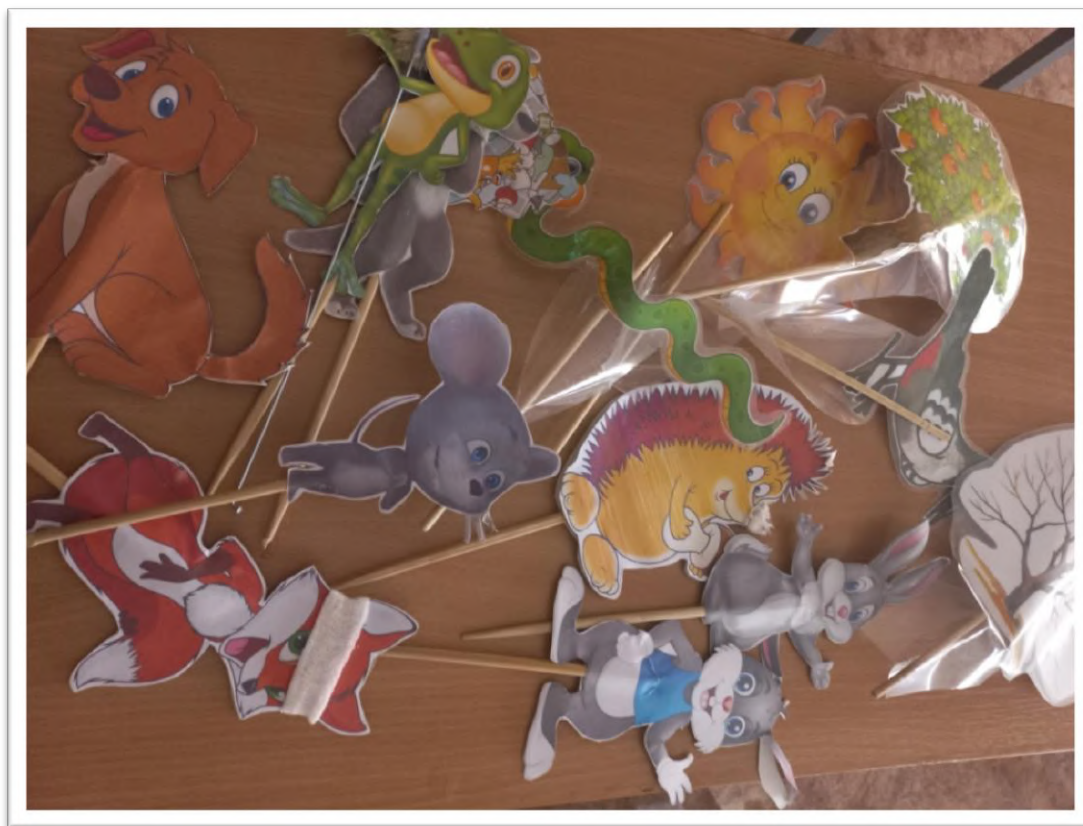
Рис. 1. Набор «театральных героев»

Итог. Ведущий подводит детей к выводу, что творчество и забота о планете неразделимы. Каждый участник — и творец, и хранитель природы.